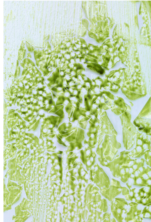
Michel Blazy, (Détail) Mur de pellicules vert , 2008, © Adagp, Paris 2020/ Photo Marc Domage

Marion Verboom s'en inspire pour réaliser des sculptures dans différentes matières (de l'acétate, du laiton, de la pierre, de la céramique...) grâce aux techniques de moulage et d'assemblage, comme dans Mimicry , sculpture érigée tel un totem.