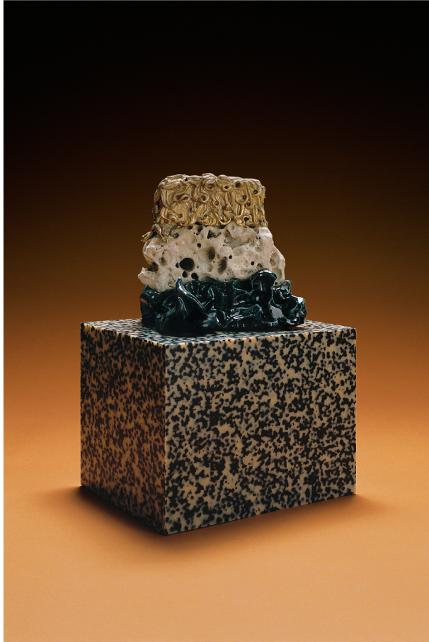
Marion Verboom, Mimicry , 2018

Ils partagent le goût de l'observation de la nature et du vivant, de leurs formes et évolutions.