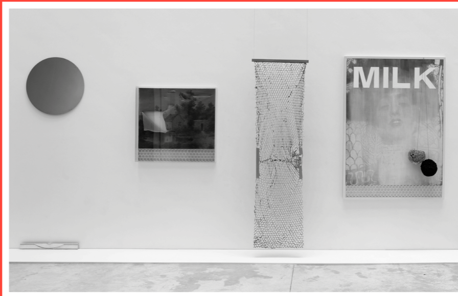
Franck Scurti, The Yellow Suite: Salaire Solaire (Sunshine), Yellow Landscape, The Soul of the Door, Judith and the Colors Catchers, Orchid, Miracle on Dunois Street, Salaire Solaire (Sunset) , 2015. Matériaux divers, 300×900×90 cm. Collection MAC VAL. Acquis avec la participation du FRAM Île-de-France. © Adagp, Paris 2017.